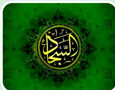
اهل بیت (علیهم‌السلام) خواهد بود.

خطبه اول: الحمد لله المتفرد بالکبریا و اشهد انه المتوحد بتدبیر الارض و السماء و اشهد ان محمداً رحمة للورا و اکمل الکملا و افضل السفرا و خاتم الانبیا و اشهد ان امیرالمومنین علی