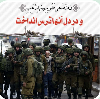
وَقَدْ فُتِنَ فِي قُلُوبِهِمُ الرَّغْبُ و در دل آنها ترس انداخت

در جریان کرواسی و بوسنی و هرزگوین، صرب‌ها مسلمان‌ها را قتل‌عام کردند و می‌گویند این صرب‌های مسیحی که به جان